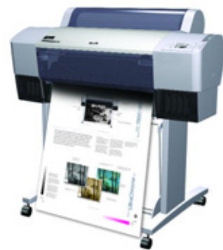
Epson Stylus Pro 7800 (largeur de 24")

Pérennité de vos images pendant plusieurs générations avec les encres Epson UltraChrome™ K3 résistantes à la lumière, conçues pour durer jusqu'à 75 ans en couleur et plus de 100 ans en noir et blanc* (en intérieur)