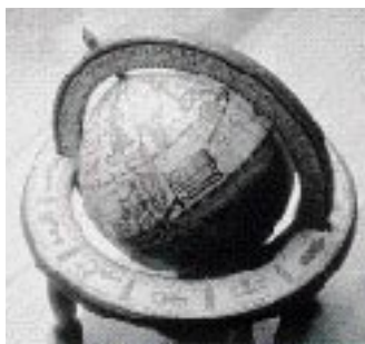
Senza MicroGray 1200

EPSON EPL-N1600 è la nuova stampante laser di rete ad alta velocità ed elevata risoluzione progettata per supportare le necessità di stampa di gruppi di lavoro di circa 15 utenti. Compatibilità con ambienti multipiattaforma, forma compatta e semplicità di gestione della carta sono altre importanti caratteristiche di questa stampante che si distingue anche per l'ottimo rapporto costo/prestazioni.