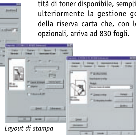
Layout di stampa