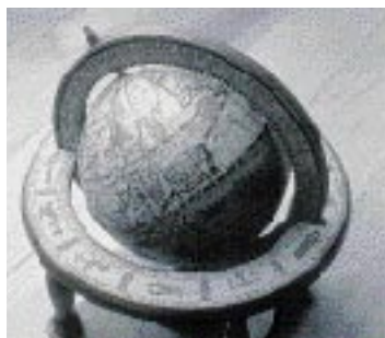
Con MicroGray 1200