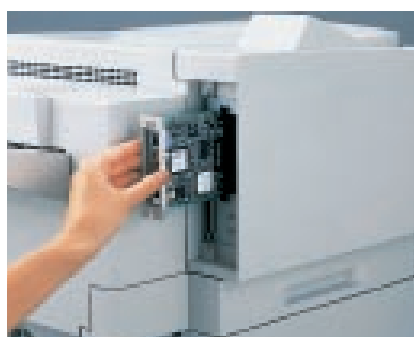
Interfaccia a cassetto EPSON Type B